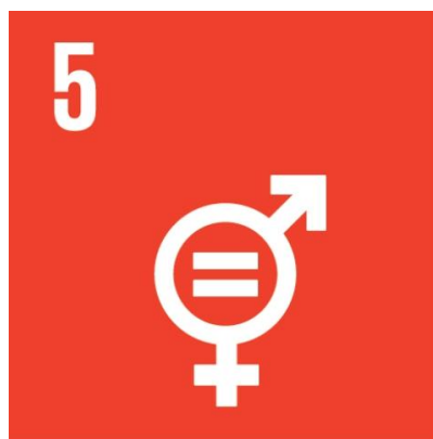
資料：SDGs 5 Goals

大英帝国から独立したインドは、不可触民の扱い、つまり、ダリットの社会的・物理的・政治的排除を法的に禁じた。ダリットに対する暴力を予防する立法がなされ、学校や公的部門での雇用、立法府におけるダリットの割当制が施行された。