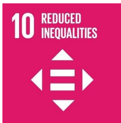
資料：SDGs 10 Goals

サロジ氏は、自らの決意と勤勉さでトップの地位に上り詰めた。彼女の成功は自身の努力によって得られたものだが、彼女は他の人々が自分の先例に続くことができるよう尽力している。もっとも重要なことは、彼女の成功がインドの数百万のダリットや女性にとって励みとなっていることだ。(10.12.2018) INPS Japan/ IDN-InDepth News