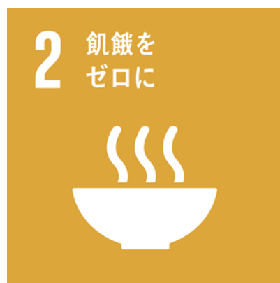
資料：SDGs Goal No. 2

ディアス議長はまた、「アグロエコロジーを基盤とした持続可能な農業や食料システムに向けた変革を可能にし、土地や水、種子といった生産資源に対する農民の権利とそれらへのアクセスを尊重し保護し満たすような方法で、法的・規制の枠組みを実行することが極めて重要です。」と語った。