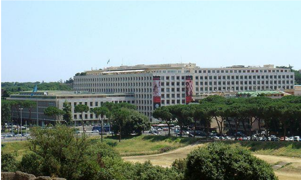
FAO's headquarters in Rome, in Via delle Terme di Caracalla.